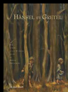
ALBUMS DUCULOT illustrations Sybill Delacroix

Un travail de comparaison du déroulement de l'histoire dans ces albums ou des différentes illustrations d'une même histoire pourra être débuté et poursuivi après le spectacle.