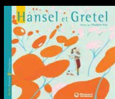
MAGNARD JEUNESSE illustrations Elisabeth Pesé