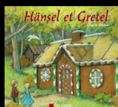
CLASSIQUES DU PÈRE CASTOR illustrations Pascale Wirth