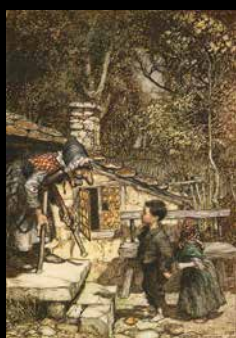
KALÉIDOSCOPE illustrations Anthony Browne

Il existe différentes versions de « Hansel et Gretel » en format album jeunesse